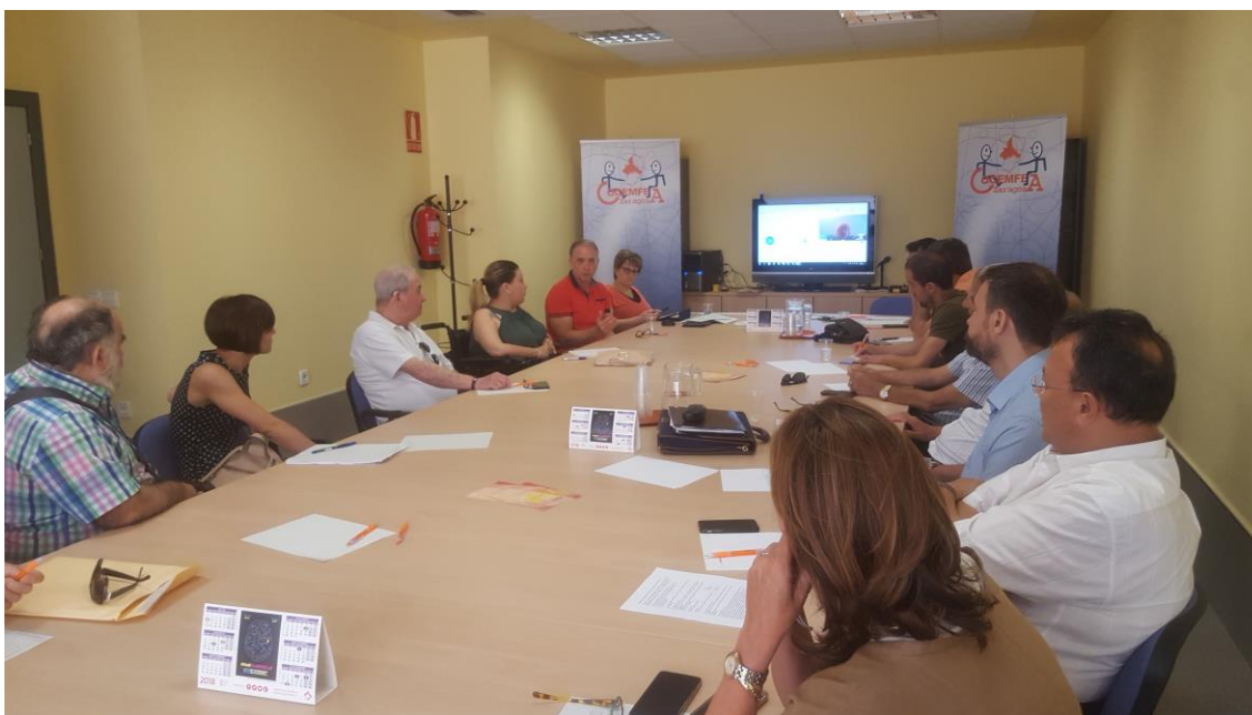
Asamblea Ordinaria Junio 2018

Desde COCEMFE Zaragoza se está intentando trabajar en el medio rural, potenciando las entidades existentes y promoviendo nuevas, para que las personas con discapacidad física u orgánica no tengan que trasladarse a la capital para obtener recursos y se desarraigen de su entorno social